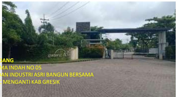
GUDANG JL RAYA PRATAMA INDAH NO 05 DALAM KAWASAN PERGUDANGAN DAN INDUSTRI ASRI BANGUN BERSAMA DESA PELEMWATU KEC MENGANTI KAB GRESIK