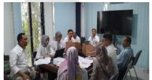
Pelaksanaan Sidang Permohonan Izin PBG - PT. ABB di Kantor PUPR Gresik – Jawa Timur

Analisa dampak lingkungan, dampak lalu lintas, kesiapan dan kesigapan perlengkapan pemadam kebakaran